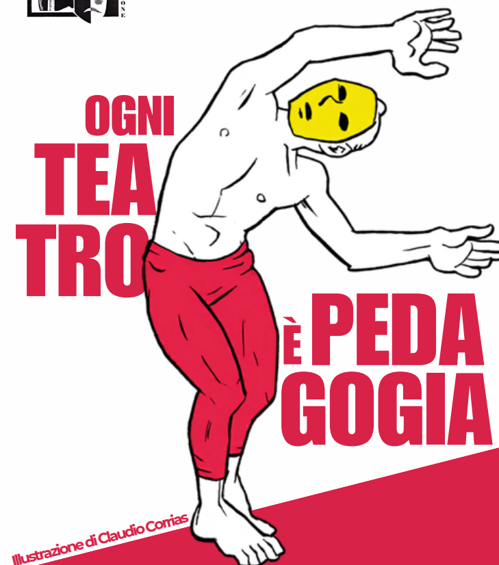
Illustrazione di Claudio Corrias